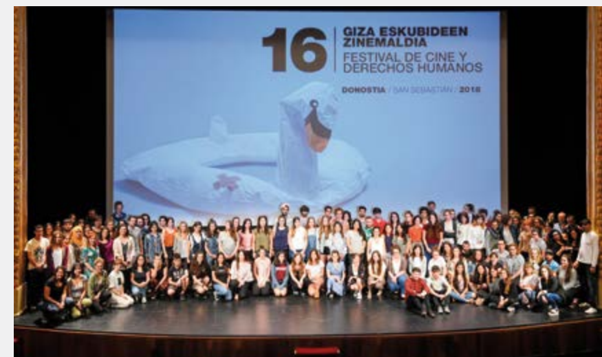
Donostiako Giza Eskubideen Zinemaldia

— Fiareri laguntzeko elkartean ere parte hartzen dugu. Haren helburua da Euskadin banka etikoaren sistema bat finkatzen laguntzea.