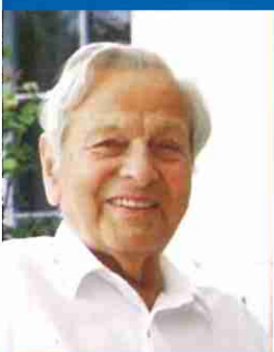
Arno Peters (1916-2002)

sun handiagoko ikuskera eskainiz, bidezkoagoa eta solidarioagoa den ikuspegia, alegia. Izan ere, herrialde bakoitzari mapan dagokion lekua eskaintzen baitio. Munduan dagoen lekua, hain justu.