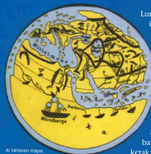
Al Idrisiaren mapa, Meka erdian duela

Beste arazoetako bat erlijio handi batzuek bultzatutako munduaren ikuspegi teozentrikoen eragina izan da. Mendetan zehar, mundua lau zela uste zenez, hura irudikatzean, hiriburu erlijiosoa maparen erdi-erdian kokatzen zuten, beheko bi mapa hauetan ikus daitezkeen bezala: bata musulmana da, duela 800 urte ingurukoa, eta bestea katolikoa, duela 750 urte ingurukoa.