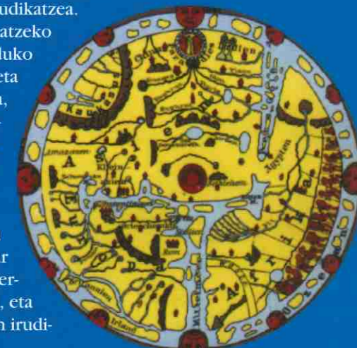
Eliza katolikoaren mapa, Jerusalem eta Belen erdian dituela

Hala ere, mapa lauen beharra izaten jarraitzen dugu: liburuetan sartzeko, begi-kolpe bakar batean kontinente guztiak ikusi ahal izateko, azterketak eta konparazioak egiteko aukera izan dezagun, eta abar. Ezinbestekoa zaigu, beraz, nola edo hala munduaren irudikapen bortxatuak erabiltzea.