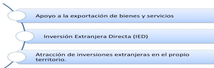
FIGURA 1: LOS 3 ÁMBITOS DE LA PIE

En este sentido debemos entender la PIE como el conjunto de políticas, medidas e iniciativas impulsadas por las instituciones públicas con el ánimo de favorecer el acceso, consolidación y ampliación de los espacios de las empresas de un territorio determinado en los mercados internacionales. Destacamos tres ámbitos principales: apoyo a la exportación de bienes y servicios, apoyo a la inversión extranjera directa, y atracción de inversiones extranjeras en el propio territorio.