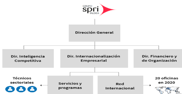
FIGURA 7: ORGANIGRAMA BTI

conjunto, se cuenta con 16 oficinas estables (que esperan ser 20 para 2020) 20 y con un equipo de 50 profesionales (30 en la sede en Bilbao, 20 en el exterior).